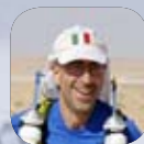
Testo di Paolo Barghini